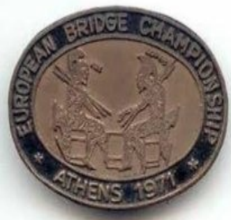
Το σήμα των αγώνων

Έτσι, το ελληνικό μπριτζ, χωρίς ακόμα να έχει αναγνωρισθεί από το Κράτος, απέδειξε ότι μπορεί να κατορθώσει τα ακατόρθωτα, αρκεί να υπάρχει ομοψυχία και μεράκι.